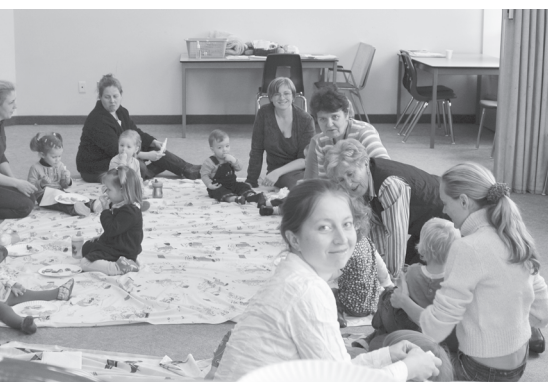
Любити Україну і шанувати Пласт дітлахів у Канаді вчать з трирічного віку.

Побачити вдалося чимало, однак по-особливому запам’яталося українське. Передовсім, справив враження інститут св. Володимира. “Навчаються у ньому як українці, – розповів наш екскурсовод пан Володимир, – так і чужинці”. А перед спорудою цієї наукової установи – пам’ят-