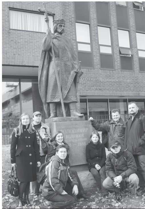
Пластуни з України – біля пам’ятника святому рівноапостольному Володимиру Великому.